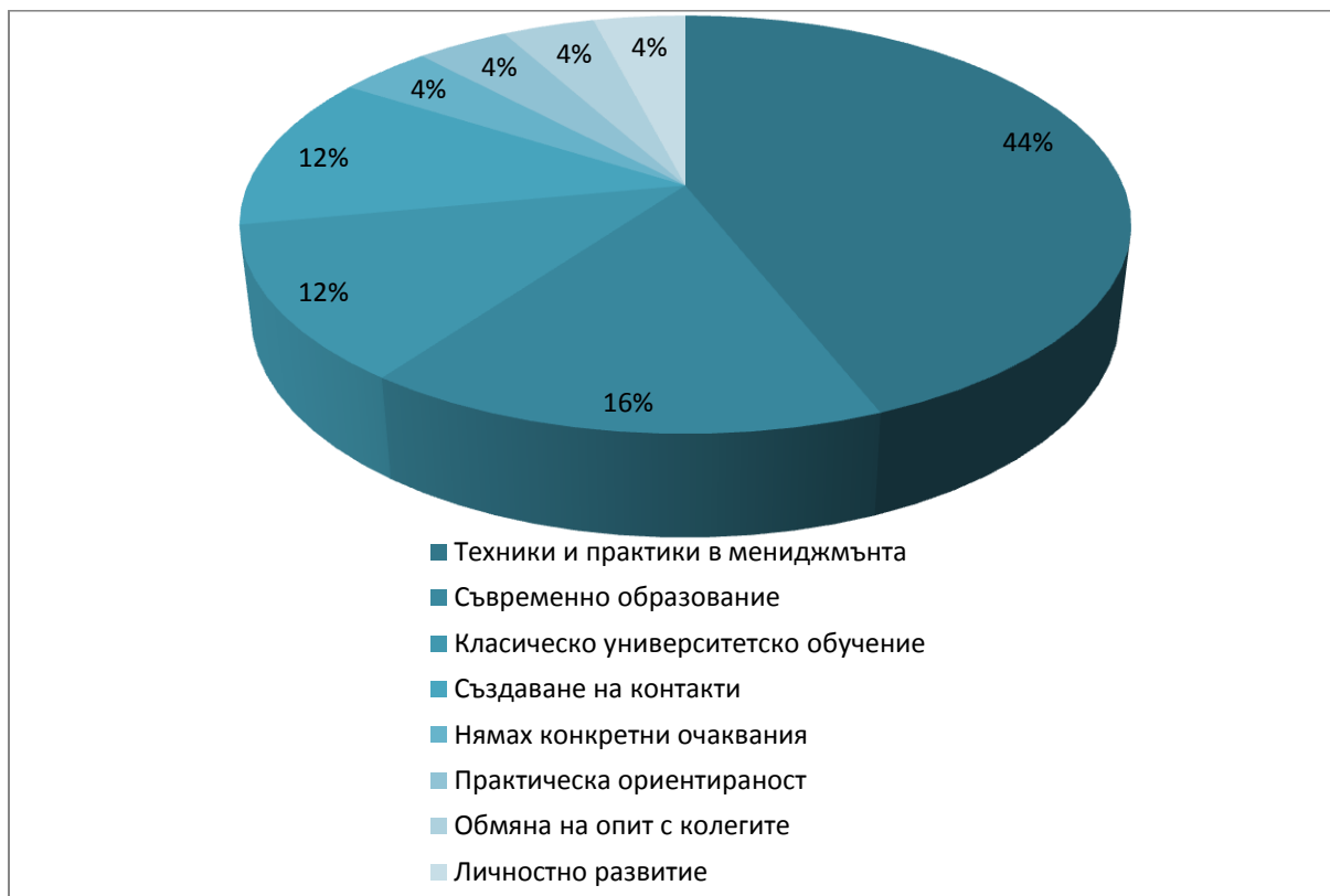
Фигура 2. С какво бяха свързани Вашите очаквания, когато се записахте в програмата?