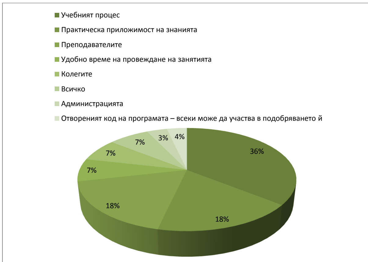
Фигура 3. Какво Ви хареса в програмата?