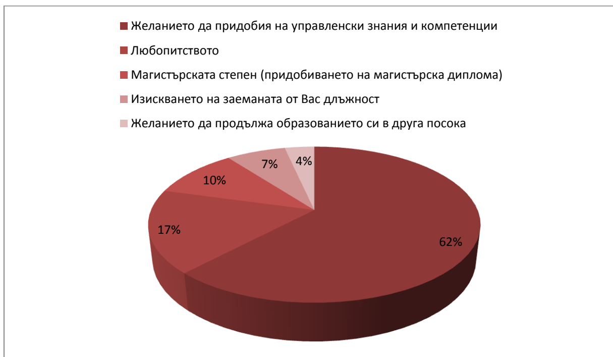
Фигура 1. Какво Ви подтикна да изучавате мениджмънт?

Участниците са посочвали повече от един отговор.